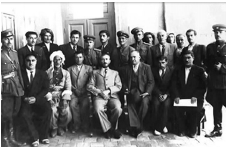
Qedrî Cemîl Paşa bi tevî Qazî Mihemed û komek rêvebirên Komara Kurdistanê

keçan” 38 û li Mehabadê “ Damezirandina Kitêbxaneyaya Millî ” 39 jî, pêngavek pîrr girîng bû. 40 Di rojnameya Kurdistanê de, behsa avakirina “Medreseya Gelawêjê” û “Medreseya Kurdistanê” hatiye kirin ku li wê derê zarok bi şev û roj dersên kurdî dixwînin. Berdewamî di rûpelên rojnameya Kurdistanê de li ser girîngî û pêdivîya xwendina bi zimanê kurdî hatiye rawestandî, nivîs hatine belavkirin û bangewazî hatine kirin. Li ser vê babetê, di hejmarê 60an de jî meqaleyek dirêj bi sernivîsa “ Millet û Xwendin ” hatiye çapkirin. Li gor agadariya Q. Cemîl Paşa: Wê demê li Mehabadê nêzikê hezar xwendekarên dibistanan hebûn û di bin alaya rengîn a Kurdistanê de bi zimanê kurdî perwerde dibûn. 41