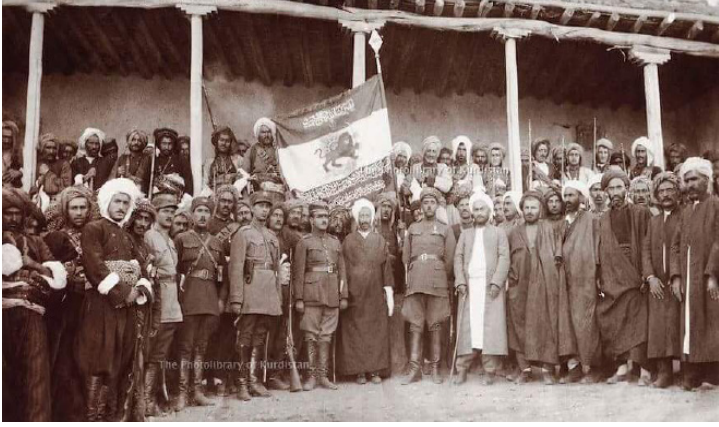
Aşiret kuvvetlerinin komutan ve sorumluları

Kürdistan'dan çekilmesinden sonra, Umer Khan tarafından alalecele Şah'a gönderilen mektupta, bir an önce İran askerlerinin Kürdistan'a yetişmesini talep ederek şöyle der: "Bütün Şikak aşireti ile birlikte İran Şah'ının bir subayı gibi emirlerinizi yerine getirmeye hazırız." Bunun için de, Şah'a olan sadakatini ispatlamak üzere, her iki oğlunu Kadir ve Lezgîn'i Tahran'a Şah'ın yanına gönderir ki İran askerleri Kürdistan'a ve bilhasa Mahabad'a doğru gelince, onlara rehberlik ve koruyuculuk yapsınlar.