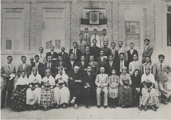
Li Mehabadê rêûresma vekirina dibistaneke jinan

bi jinan re kombûn çêdibûn, di van kombûnan de pirsgerêkên jinan dihatin guhdarkirin û paşê ji teşkilatên partiyê re dihatin pêşkêşkirin ji bo çareseriyê.