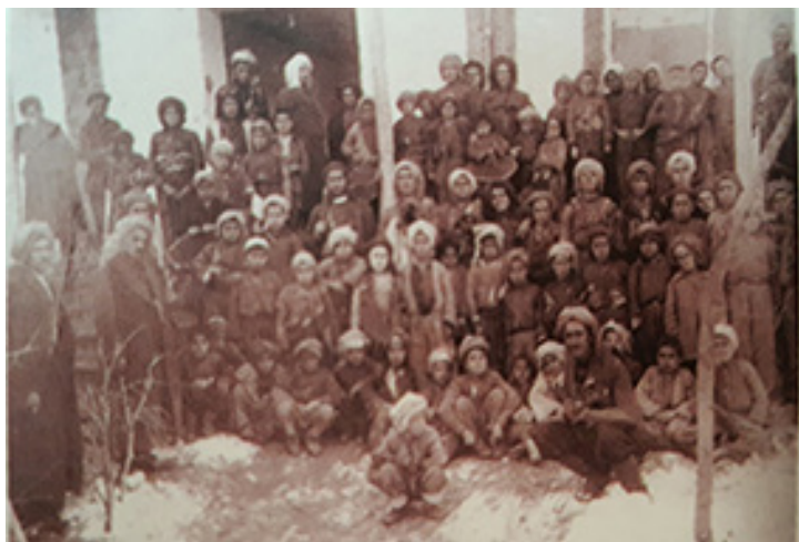
Xwendekarên dibistanên Komara Kurdistanê

Di roja ragehandina Komarê de kurdî, wek zîmanê fermî yê Komarê hatîye qebûlkirin. Ji xwe di benda sêzdeh a bernameya PDKê de jî hatîye destnîşankirin ku “Ji bo armanca pêşvebirina ilm