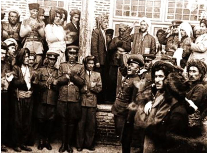
Rêvebirên Komara Kurdistan

Damezrandina Komara Kurdistanê, berhemê bîr û îradeya neteweyî ya mîletê Kurdistanê bû û di dîroka hevdem a neteweya Kurd de dewleta yekemîn bû, mixabin temen kurt bû û nêzîkê 11 meh li ser pîyan ma.