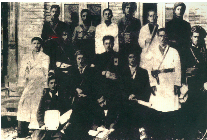
Hewşa Çapxaneya Kurdistan