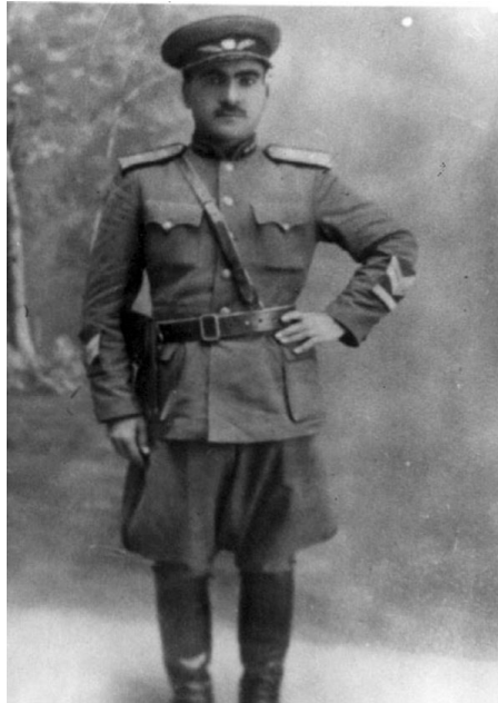
Serokerkanê Komara Kurdistanê: General Mistefa Barzanî

Li pey vê biryarê, di şeva 17.12.1946an de General Mistefa Barzanî bi tevî hinêk takekes û rêberên Barzanîyan hatin Mehabadê ji bo hevdîtina bi Pêşewa Qazî Mihemed re. Qazî