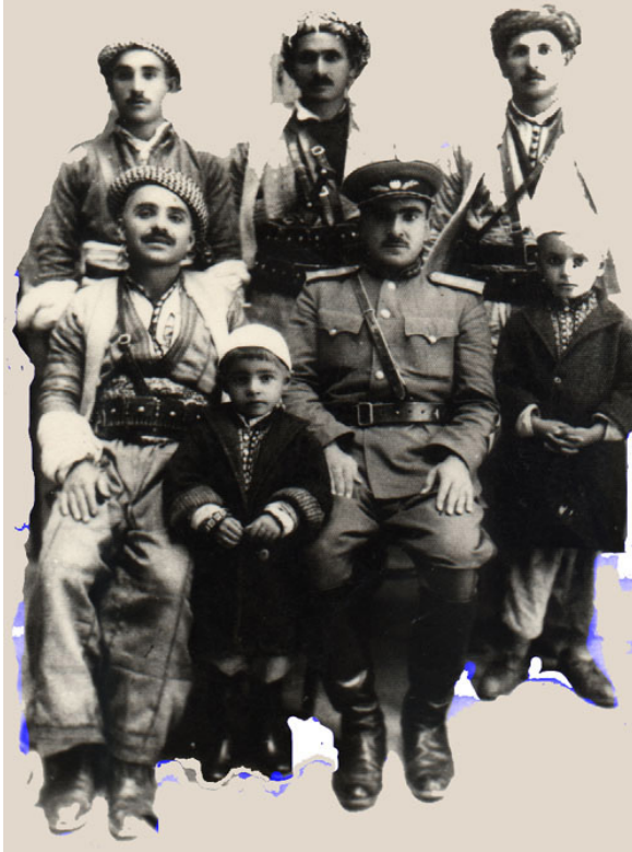
General Barzanî digel komek pêşmerge û zarokên wan

Jiber çi dujmin dijberê li vî kûrey erd e Bi te hate naskirin gel û nîştimanî Kurdewarî Tu yî berz û bariz, le her layê dîyarî Bê te ku dujmin bi ser nîştiman da zal e Bê te gel wek teyrê nexweş û bêperr û bal e Tu merdî meydan û şerr û roley Warîsê pîrozê Îrsî Barzan û toley Bi mêjû xawên nîştiman û gel û xêw î Bi berzît Baz î Barzan û lûtkeyê ko yî Lay dujmin barîz û bi navbangî bi navan Bibîstin dujmin çirkemîze digrê li tawan