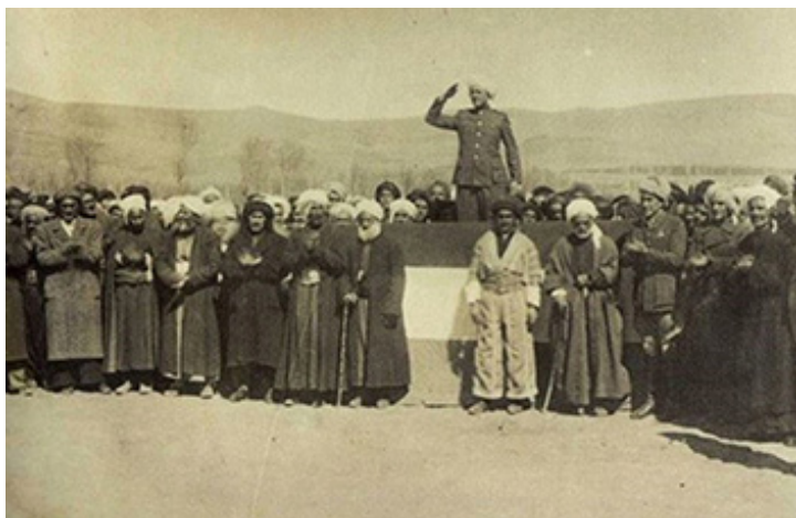
Rêûresma ragehandina Komara Kurdistanê (1946)

Di roja 22.01.1946an de damezirandina Komara Kurdistanê li meydana Çarçiraya bajarê Mehabadê hate ragehandin. Alaya Kurdistanê bi xwendina sirûda “Ey Reqîb” hate bilindkirin û Pêşewa Qazî Mihemed bi tevî komek rêvebirên PDK, serokeşîr û giregirên Kurdan li hemberî zêdetirî 20 hezar Kur- distanîyên li wê meydanê bi şehamet û tewazîyek tejiyêvîn sekinî û weha axivî: