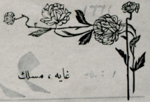
غایه ، مسلك

علمه اشد احتیاج ایله محتاجدر . کردك بو آهقدر ، یكانه مظهرتی ، اجر و مكافاتی ، هان دائما ، كندیسی بیلن دشمنلریله بیلمین دوستلریك، اكثریا حقدسز ، تعریضات و آتھا- ماتنه آماج اولماسیدر . الك منصف و قیمت شناس اولق لازمكمن زمانمزبیله كردك خصیصه غایهسینی وحشت و تالانكری دن عبارت بیلور .